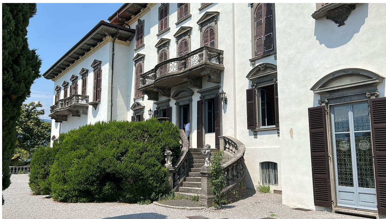
Sede della Scuola di Chimica Fisica 2023

Si è conclusa con successo la scuola di Chimica Fisica 2023 dedicata ai nanomateriali e nanostrutture. Ricercatori di alto profilo internazionale hanno approfondito aspetti di sintesi, caratterizzazione avanzata e nuove applicazioni dei nanomateriali (qui sotto alcune foto dell'evento).