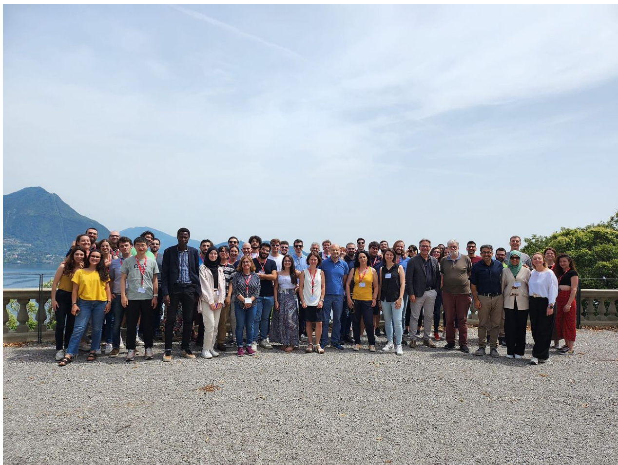
Partecipanti alla Scuola di Chimica Fisica 2023