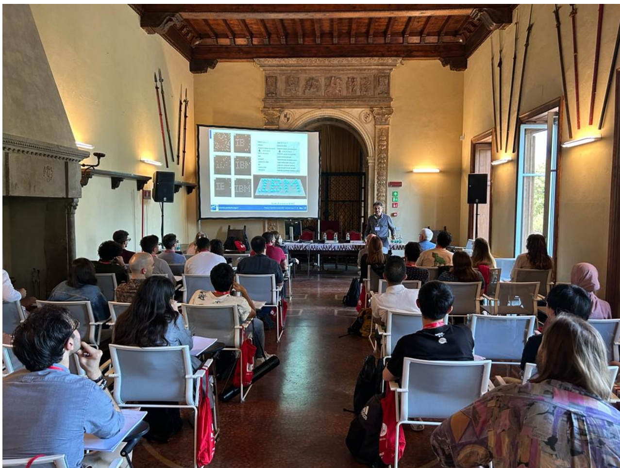
Una sessione dei lavori della Scuola di Chimica Fisica 2023