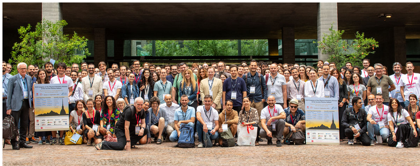
Partecipanti al Congresso di Chimica Fisica di Torino 2023