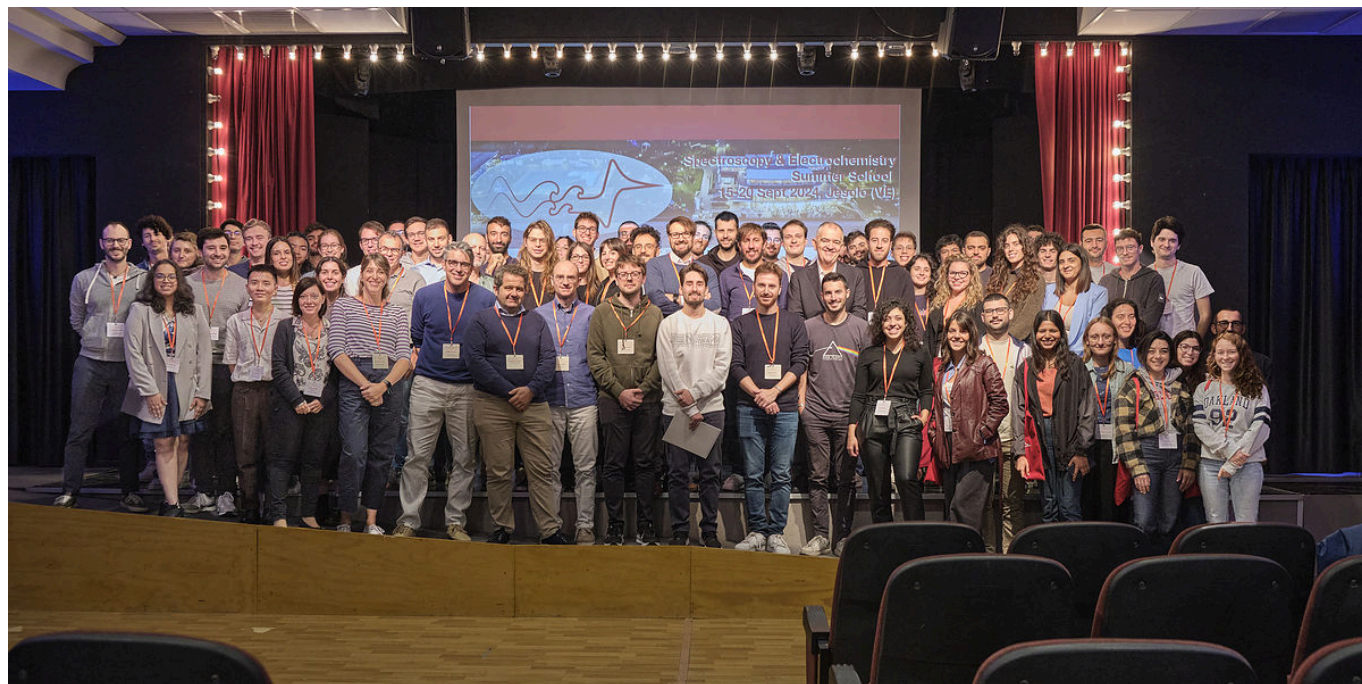
Partecipanti alla scuola 'Spectroscopy and Electrochemistry Summer School' (SPEC2024)

sito web: https://www.disc.chimica.unipd.it/spec_school [16]