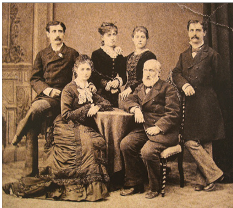
Fig. 1 - Francesco Selmi in età avanzata con la famiglia

Si è accennato del suo impegno come patriota risorgimentale, una scelta che lo costrinse a lasciare il Ducato di Modena e a recarsi in esilio. Nel 1848 riparò a Torino, dove fu accolto nel laboratorio dell’amico Ascanio Sobrero (1812-1888), con il quale collaborò nelle ricerche sui composti dello zolfo, e che lo presentò anche all’Accademia delle Scienze [8]. Ebbe missioni non solo scientifiche ma anche politiche e, nel 1859, Cavour e La Farina lo incaricarono di promuovere l’insurrezione del Ducato di Modena, cosa che fece con un proclama inviato da Parma per incitare il popolo alla rivolta. Dopo l’Unità, Selmi divenne Capo di Gabinetto del