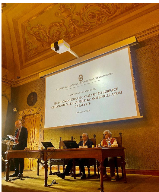
Fig. 1 - Sessione mattina del 30 presiedono G. Pacchioni, V. Aquilanti e A. Sgamellotti

Hanno presieduto la sessione i Lincei Proff. V. Aquilanti, G. Pacchioni e A. Sgamellotti (Fig. 1).